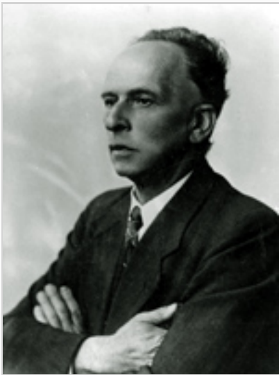
afb. Onbekend, ca 1940